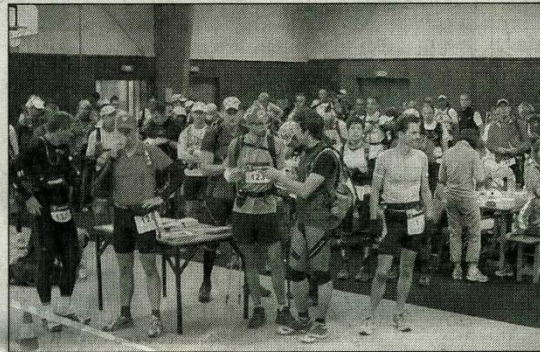
Les coureurs attentifs pour le briefing, avant le départ