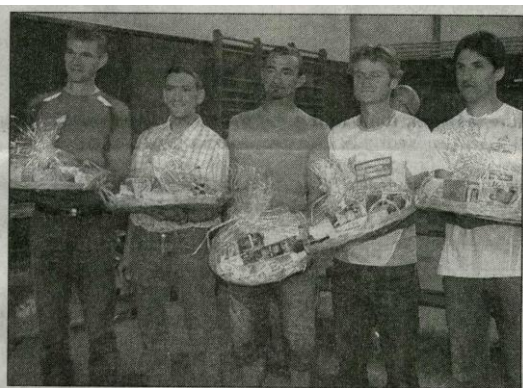
Podium masculin 103 km