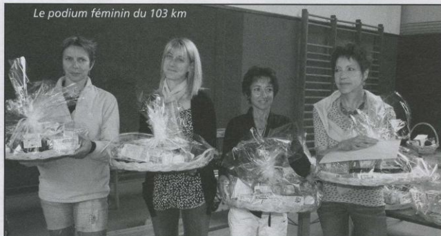
Le podium féminin du 103 km

Petite cérémonie conviviale, ce dimanche matin 15 mai, à la salle des sports où les coureurs et organisateurs étaient invités à clore la 4 e édition de l'ultra-trail et la 10 e des Coursières des Monts du Lyonnais qui s'étaient disputés la veille. Dans un souci d'équité et